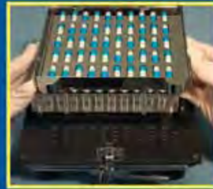
3. Откройте пластину для закрытия и установите Ориентатор на Наполняющее устройство в положение "I"