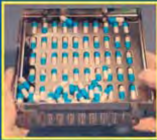
1. Загрузите 50+ капсул в Ориентатор, распределите капсулы по ячейкам