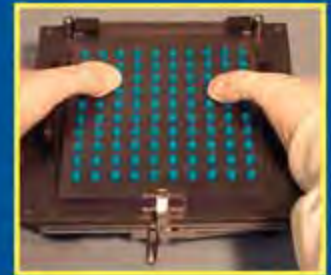
12. Установите верхнюю пластину на устройство наполнения. Для закрытия капсул сожмите верхнюю и нижнюю пластины.