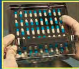
2. Поднимите рамку и удалите лишние капсулы.