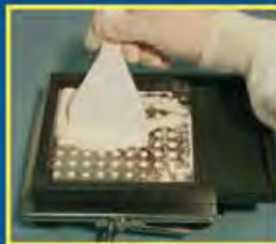
10. Используйте лопатку для равномерного наполнения капсул. Переместите остатки порошка на накопитель