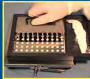
11. Используйте подпрессовщик порошка для равномерного заполнения капсул. После того, как все капсулы наполнены, снимите рамку для порошка