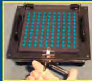
7. Закройте пластину для закрытия капсул и закройте замок. Переместите рукоятку запирающего устройства для фиксации тел капсул в наполняющем устройстве