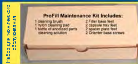
Набор для технического обслуживания

Устройство наполнения таблетками устанавливается на наполняющее устройство после открытия капсул.