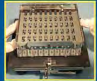
4. Нажмите на подвижную пластину Ориентатора, капсулы передаются в наполняющее устройство