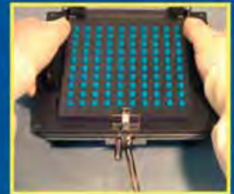
8. Для открытия капсул поднимите верхнюю пластину устройства наполнения капсул. После открытия капсул переместите рукоятку запирающего устройства в исходное положение, освободив тела капсул