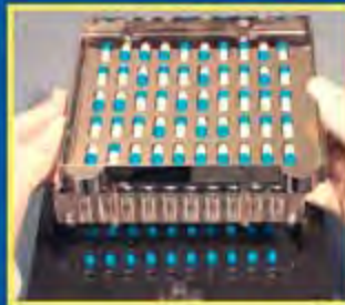
6. Для наполнения оставшихся ячеек повторите процедуру 1-4 установив Ориентатор в положение "II"