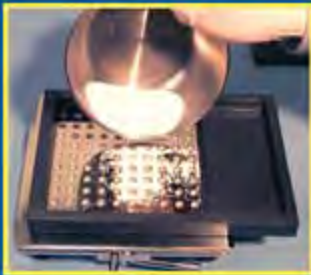
9. Установите рамку для порошка и высыпьте заранее подготовленную навеску продукта