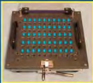
5. Снимите Ориентатор. Капсулы заполнили каждый второй ряд